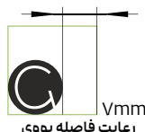
رعایت فاصله یووی 7mm