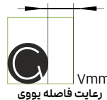
رعایت فاصله یووی