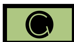
عدم استفاده از کادر